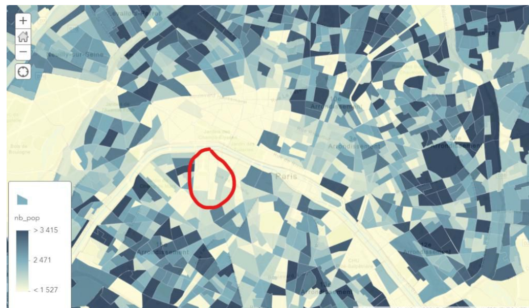
Population par quartiers (données APUR)

https://www.insee.fr/fr/statistiques/1405599?geo=DEP-75+COM-75107+COM-75119